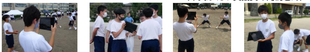
そーらんの練習でも chrome book(クロームブック)が活躍しました